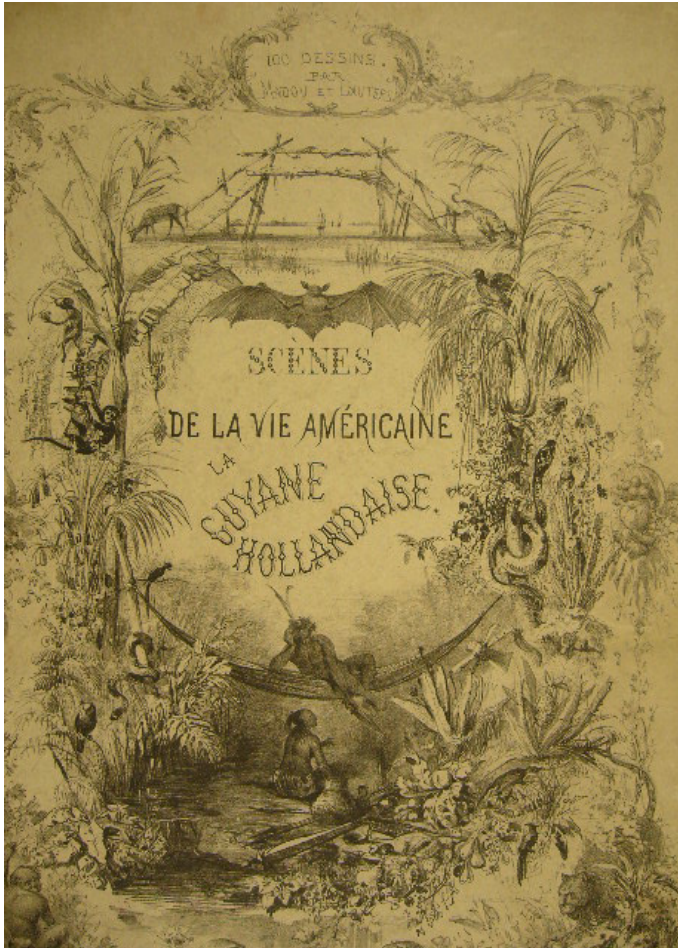
Titelpagina van een van de boeken van Benoit over Suriname