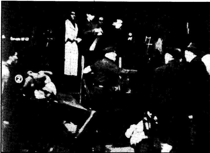
Vertrek uit Westerbork