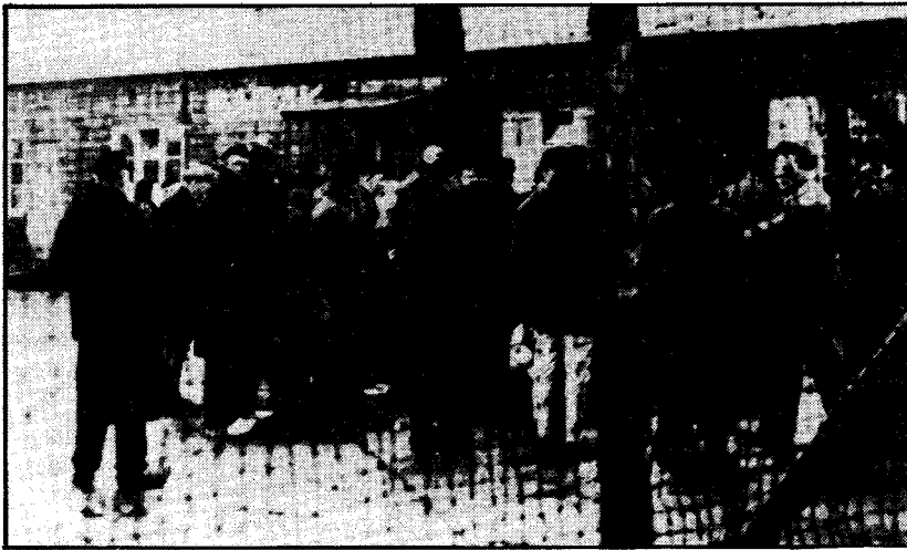
Gevangenen in het concentratiekamp Amersfoort.