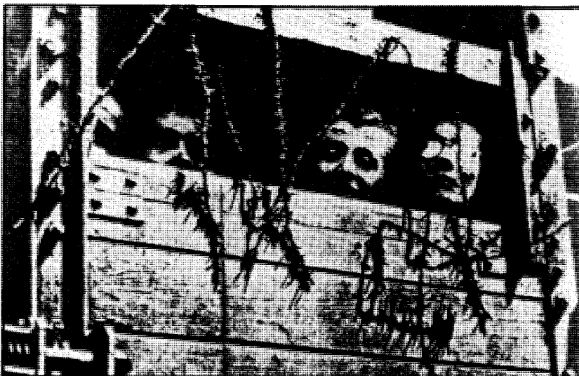
In de trein