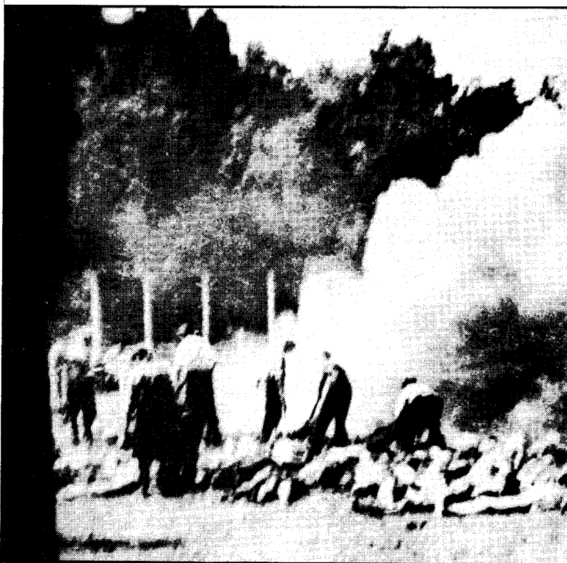
Lijkenverbranding in de openlucht. Deze foto werd gemaakt door een gevangene in Auschwitz (vandaar de kwaliteit).

Met Eichmann heb ik dikwijls en uitvoerig gesproken over alles wat met de 'Endlösung' verband hield, zonder echter ooit mijn innerlijke noodbloot te leggen. Ik heb geprobeerd uit Eichmann zijn innerlijkste overtuiging over deze oplossing los te trekken. Maar zelfs in het verste stadium van alcohol-welsprekendheid — als we met ons beiden waren — verdedigde hij altijd als bezeten de volkomen vernietiging van alle bereikbare Joden. Zonder erbarmen, ijskoud moesten we zo snel mogelijk de vernietiging uitvoeren. Elke genegenheid, ook de geringste, zou zich later bitter wreken.